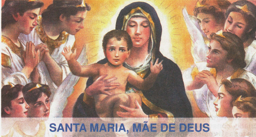
SANTA MARIA, MÃE DE DEUS

Sugestões: 1) Na procissão de entrada, levar a cruz, o Leccionário e uma bandeira branca, símbolo da paz. 2) Após a saudação, o presidente pode convidar para os cumprimentos de "feliz ano-novo".